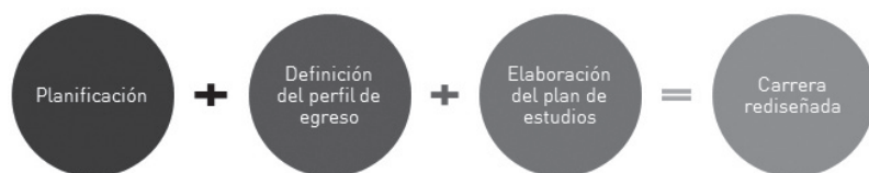
Figura 2. Etapas del rediseño curricular